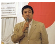
総社YEGの頼経会長挨拶