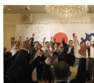
全員で倉敷YEG恒例の「日本一の朝市」!