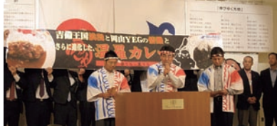
岡山YEG会員研修委員会「温羅カレー」