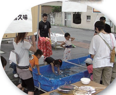
子供達が大好きな うなぎの掴み取りはその場で 焼いてもらえます