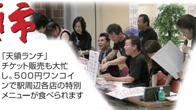
「天領ランチ」 チケット販売も大忙 し。500円ワンコイ ンで駅周辺各店の特別 メニューが食べられます