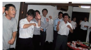
とらやさんで大盛り上がり 最後は全員で「アブラハムの踊り」