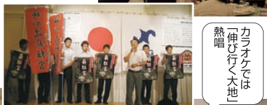
カラオケでは 「一伸び行く大地」 熱唱