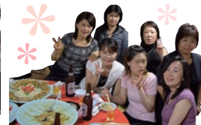
倉敷YEGきれいどころ集合