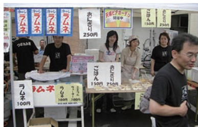
青年部による天領ピアガーデンはイベント広場で開催