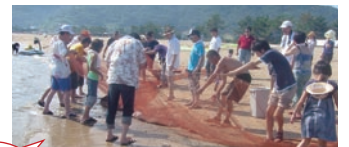
沙美の浜でイエーイ