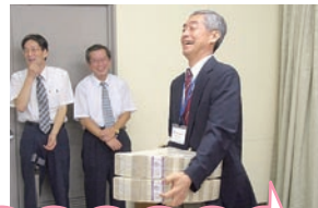
夢の3億円を持って大はしゃぎの3人。