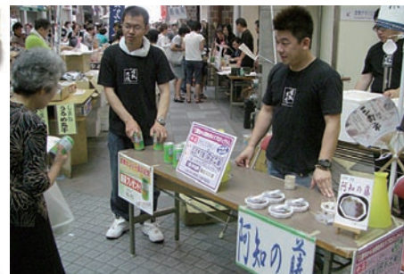
三倉市涼菓「阿知の藤」は夏らしいさわやかなお菓子です