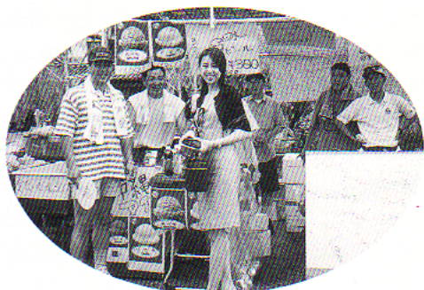
美女との記念撮影