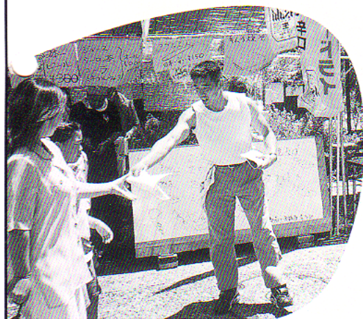
一般の方に呼びかける中田副会長