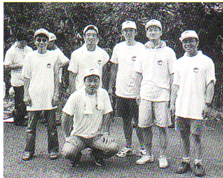
トライアスロン会場にて

9月13日、倉敷商工会議所において交流委員会担当により、第3回例会を開催いたしました。