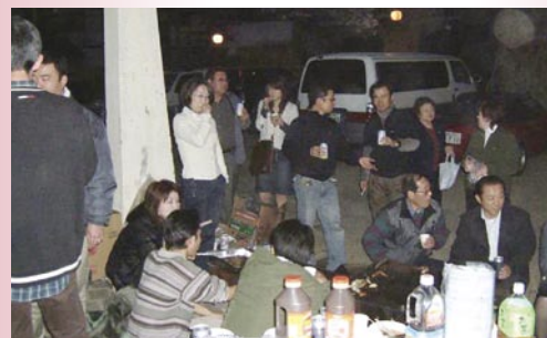
夜が更けても話は尽きません。