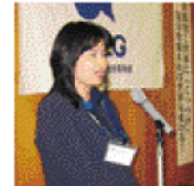
二宮委員長 委員会報告