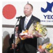
柳本さんより、ご挨拶。