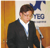
堂姐委員長 委員会報告