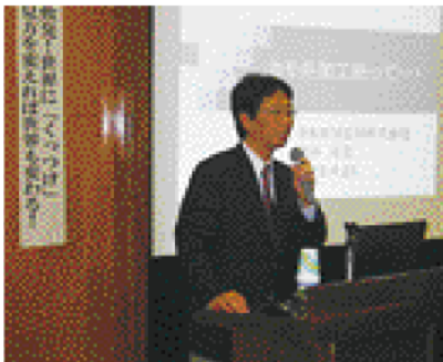
鴨井OBよりお話をいただきました。